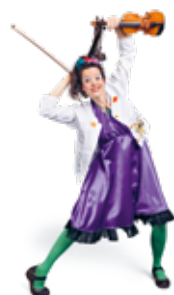
Dre Double Croche