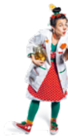
Dre Piri Piri