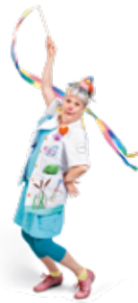
Dre Gili Gili