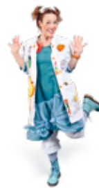
Dre Lili PoP